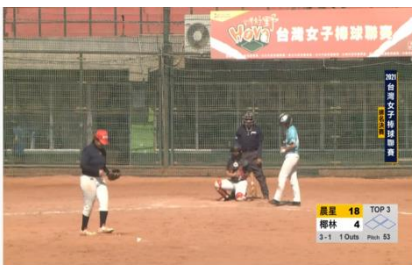
2021台灣女子棒球聯賽 排名賽 晨星 vs 椰林