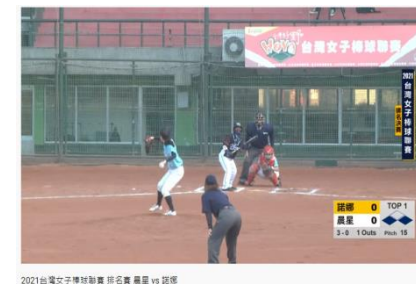
2021台灣女子棒球聯賽 排名賽 晨星 vs 諾娜