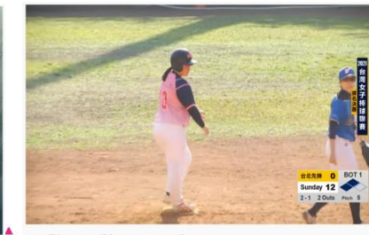
2021台灣女子棒球聯賽 排名賽 Sunday vs 台北先鋒