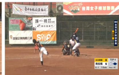
2021台灣女子棒球聯賽 四強賽 台北御聖 vs 南投縣