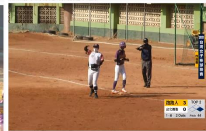
2021台灣女子棒球聯賽 四強賽 台北御聖 vs 跑跑人