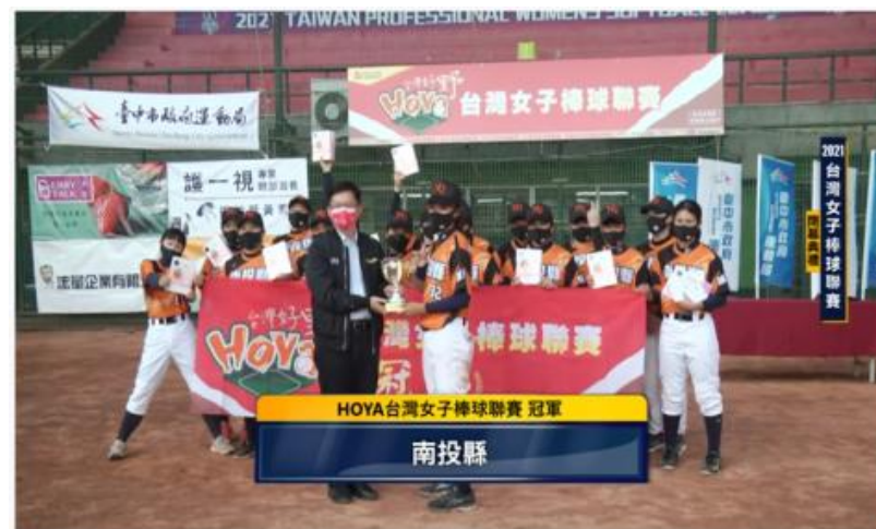
2021台灣女子棒球聯賽 閉幕典禮