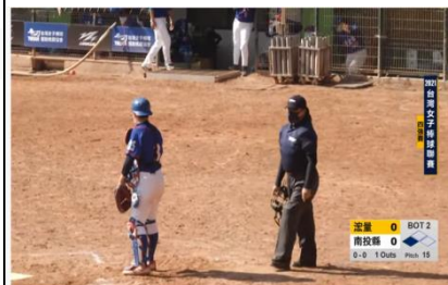
2021台灣女子棒球聯賽 四強賽 南投縣 vs 泓量

(五) 台灣女子棒球聯賽 閉幕典禮 https://youtu.be/-50TCnmJE00