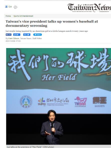
(TAIPEI) Taiwan News — Vice President Lai Ching-de (賴清德) turned up to the premiere of a documentary about women's baseball on Sunday (Dec. 26), saying that baseball is a great sport and one that should be enjoyed by man and woman alike, according to a CNN report.

https://www.taiwannews.com.tw/en/news/4389026