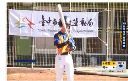
2021台灣女子棒球聯賽 排名賽 椰林 Warriors vs 木棉花