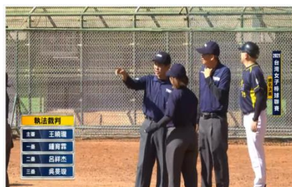
2021台灣女子棒球聯賽 排名賽 Sunday vs 日漾