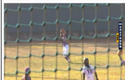
2021台灣女子棒球聯賽 季軍賽 跑跑人 vs 泓量