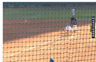
2021台灣女子棒球聯賽 排名賽 台北先鋒 vs 臺南漁光