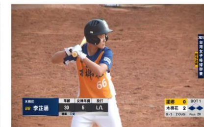
2021台灣女子棒球聯賽 排名賽 諾娜 vs 木棉花